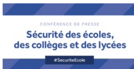
Sécurité des écoles, collèges et lycées