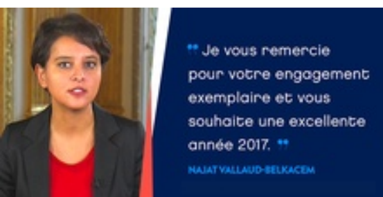
Najat Vallaud-Belkacem vous présente ses meilleurs vœux pour l'année 2017