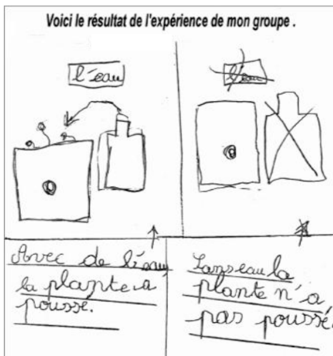
Figure 2. Exemple de représentation schématique rapportant les résultats de l'expérimentation.

Il est possible de prolonger cette expérimentation sur l'eau comme facteur nécessaire à la croissance des végétaux 4 .